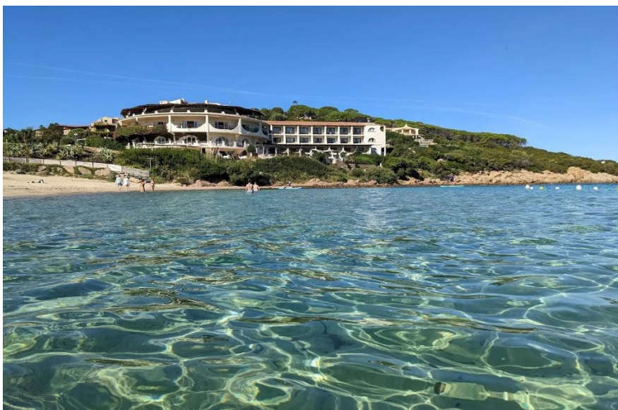
Hotel Baja Sardinia

Alloggeremo presso l' Hotel Baja Sardinia un ottimo albergo 4 stelle, affacciato su un mare cristallino con una bellissima vista della Baja e dell'arcipelago della Maddalena.