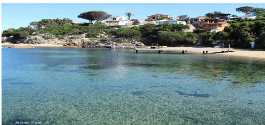
Porto Rafael, un piccolo borgo sul mare