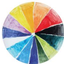
Creative Workshops Icaria by Artemis Studio