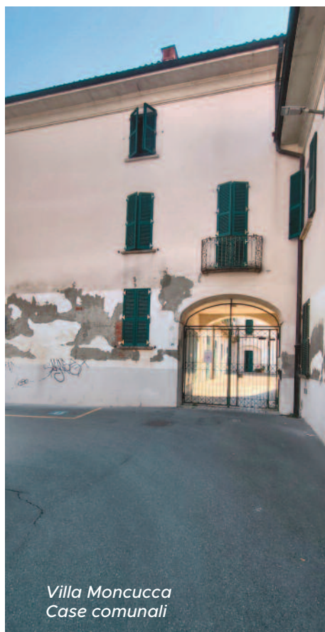
Villa Moncuca Case comunali

Inoltre, riteniamo non più rinviabile, dopo anni di chiacchiere, la manutenzione dello storico edificio comunale di Villa Moncuca , ristrutturato e reso perfettamente agibile nel lontano 1991, con la consegna degli alloggi alle famiglie assegnatarie. Oggi in questo edificio risultano troppi alloggi vuoti anche per lo stato molto trascurato della struttura, determinato dalla negligenza delle ultime amministrazioni, responsabili della mancata manutenzione.