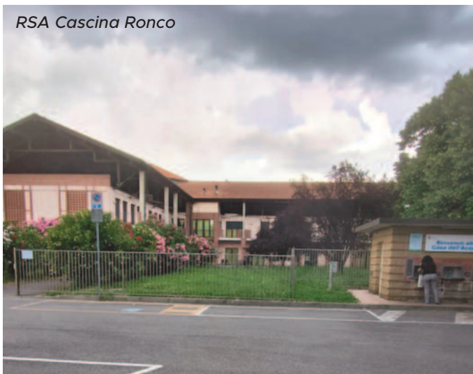
RSA Cascina Ronco

Chiediamo che si proceda concretamente, senza più rinvii e lentezze ingiustificabili (si sono già persi parecchi anni per scelte amministrative sbagliate), all'avvio delle procedure e della gara per l'ampliamento della RSA per anziani di Cascina Ronco e per l'aggiudicazione della gestione. Anche in questo caso è stata attribuita con determina del 25 maggio 2026 un'altra consulenza economicamente rilevante (circa 40.000 euro) per concludere l'iter di gara, determinando una sovrapposizione totale ai compiti d'Istituto che l'Ente deve svolgere direttamente.