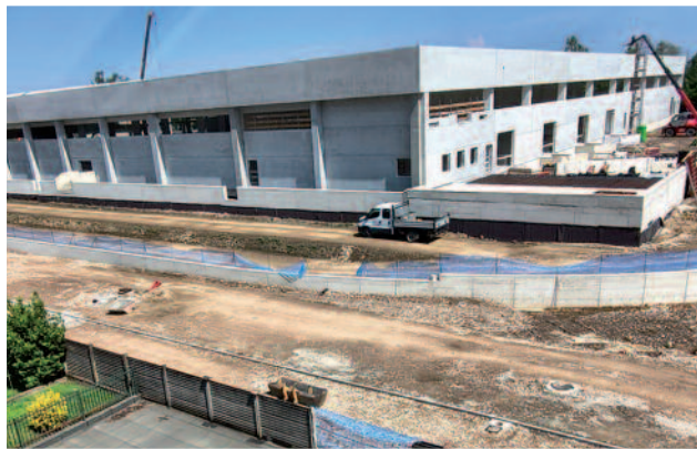
Cantiere commerciale San Pedrino