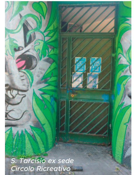
S. Tarcisio ex sede Circolo Ricreativo