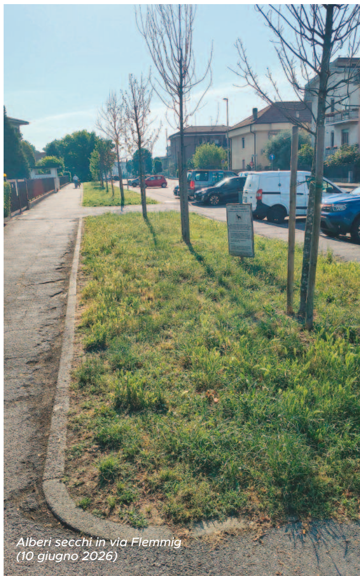
Alberi secchi in via Flemmig (10 giugno 2026)