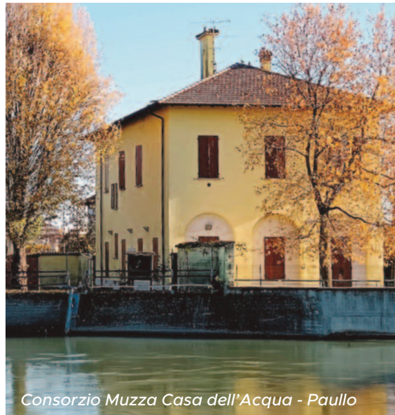
Consorzio Muzza Casa dell'Acqua - Paullo