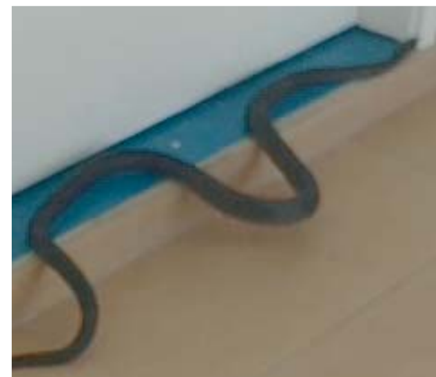
un biacco alla porta di casa