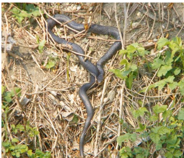
un esemplare nel suo habitat naturale