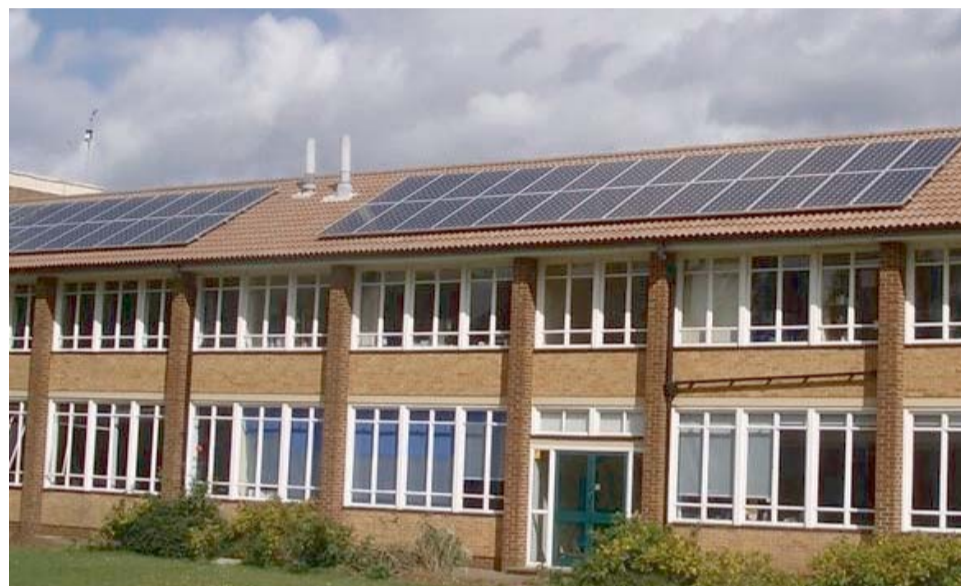
Esempio di struttura scolastica dotata di pannelli solari

La rivincita della generazione Greta Thunberg, insegnanti e studenti del Montalcini hanno vinto e partecipato nell'ambito "Giovani" con un progetto sulle energie rinnovabili nelle scuole cittadine