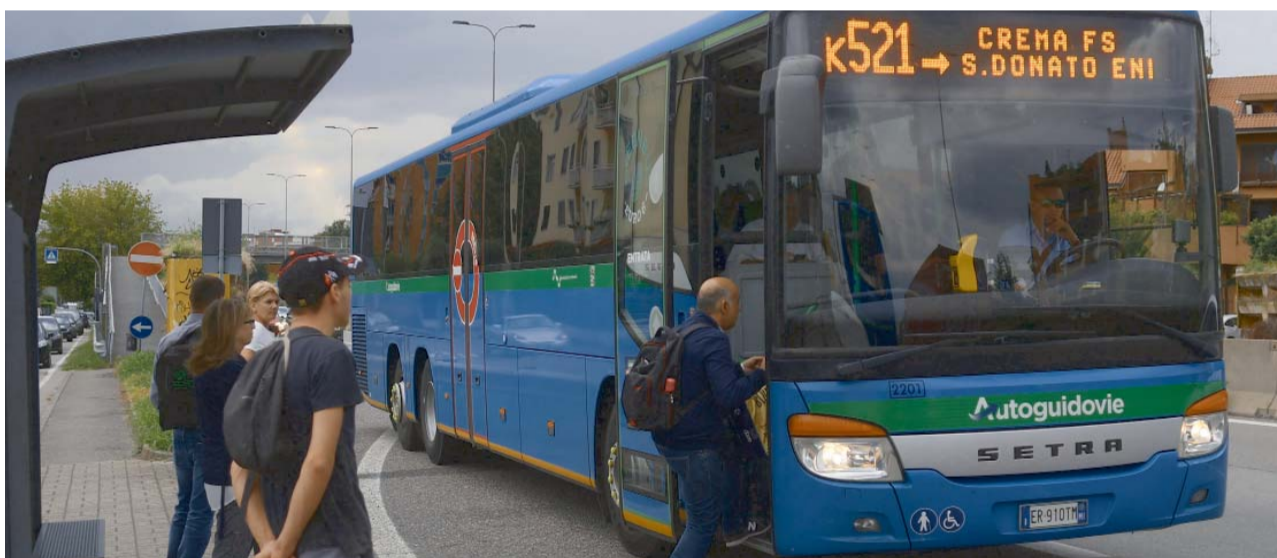
All'interno a pagina 2