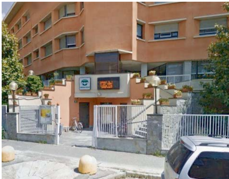
L'ingresso del poliambulatorio al Castellini

A fine anno scadrà il contratto d'affitto, rinnovato per due anni nel 2017, e ancora non ci sono certezze per il futuro. Mammi: «Il territorio non può rimanere sprovvisto di un polo ambulatoriale»