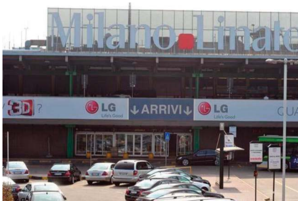
L'ingresso del terminal Enrico Forlanini

Archiviata la stagione dei maxi eventi, a partire dal 26 ottobre sono attesi i primi atterraggi, dopo tre mesi che hanno portato alla totale riqualificazione delle piste. Ma i lavori proseguiranno fino al 2021