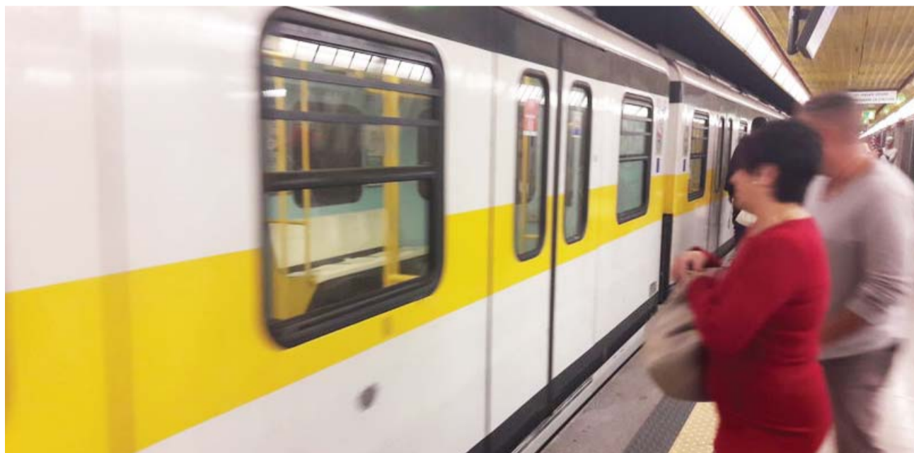
All'interno a pagina 5

PAULLESE: SI PREANNUNCIA UN AUTUNNO CALDO PER GLI UTENTI DEL TRASPORTO PUBBLICO I PENDOLARI SPERANO NEL MANTENIMENTO DEL SERVIZIO DOMENICALE FIOCCANO LE CRITICHE SULLO STUDIO DI FATTIBILITÀ