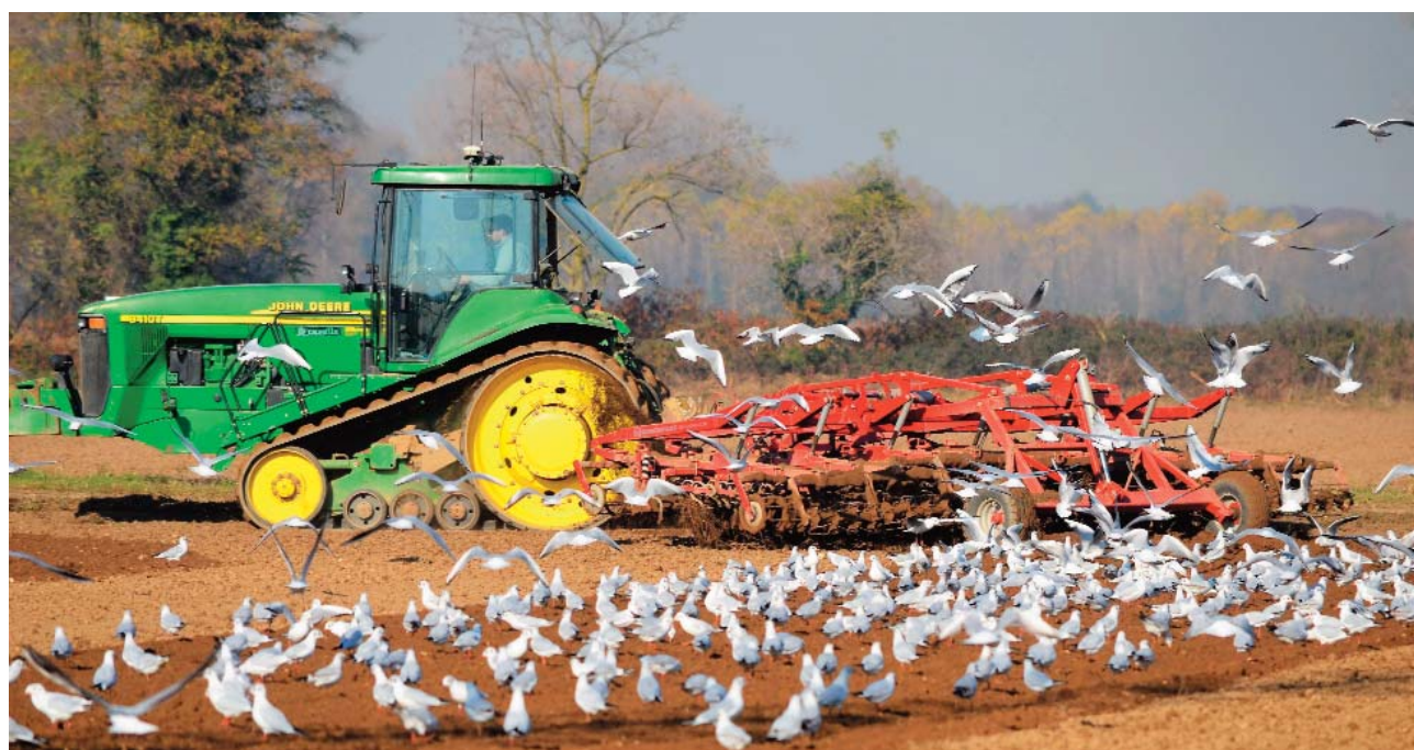
Gabbiani comuni, seguono un trattore durante la lavorazione del terreno

Si nutre principalmente di pesci, che cattura sul pelo dell'acqua o immergendo la testa, di invertebrati ac-