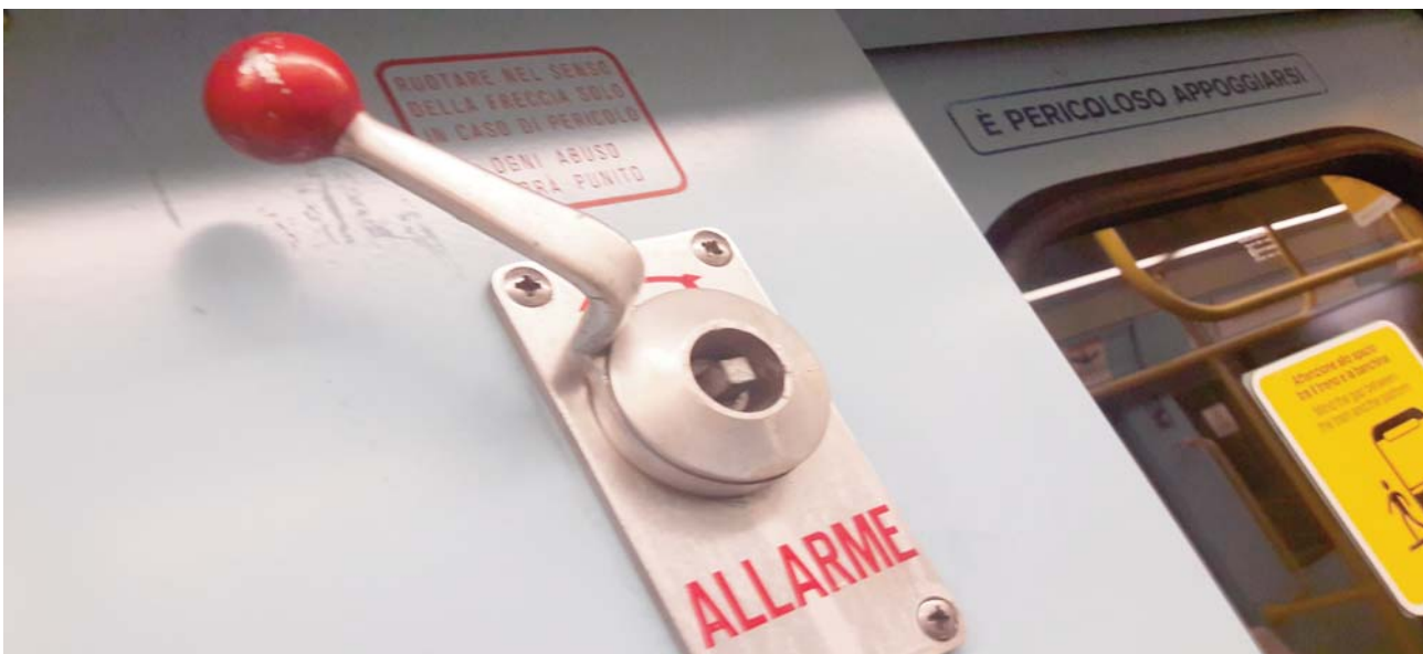
All'interno a pagina 2

All'interno a pagina 4 Peschiera, odori insopportabili a Bellaria