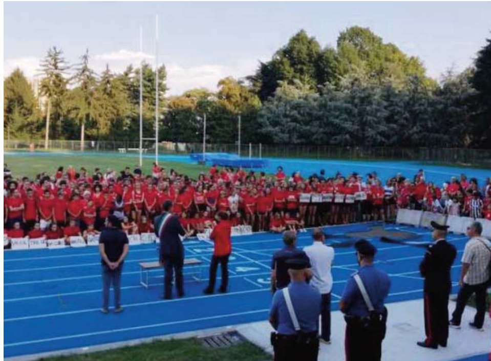
un momento della manifestazione

Centinaia di giovani atleti, insieme alle rappresentanze istituzionali e numerosi sandonatesi, si sono riuniti presso la pista di atletica del Mattei, gravemente danneggiata nei giorni scorsi. Checchi: «La Comunità è coesa»