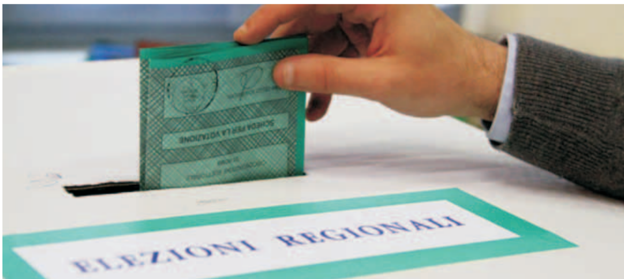
All'interno a pagina 9