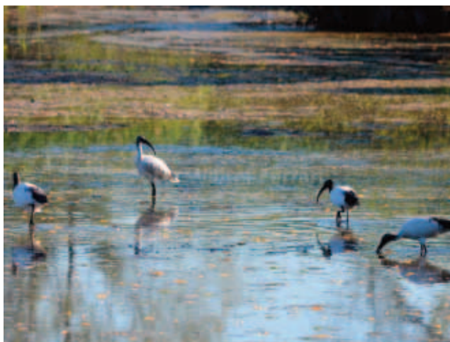
Ibis nei campi del Sud Est Milano