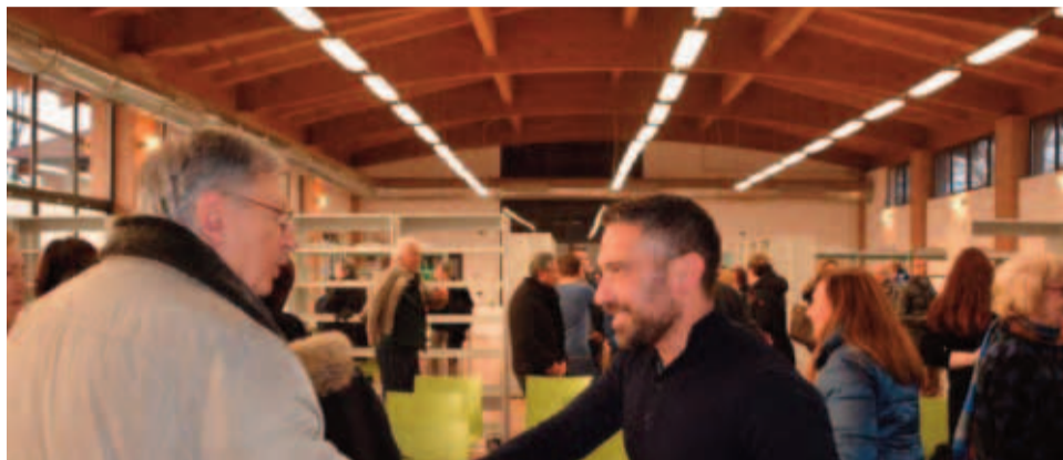
la presentazione del nuovo Centro culturale ai cittadini

Una struttura da 300 metri quadrati presso il Parco Freud con aule studio, area video, postazioni internet e un'ala ludico-ricreativa